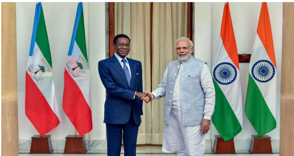
El Honorable Primer Ministro Modi se reúne con Su Excelencia el Presidente Obiang en Nueva Delhi antes de la Fundación Conferencia sobre Alianza Solar Internacional en marzo de 2018.

La crisis actual ha mostrado la impermanencia de las cosas y, por lo tanto, ha requerido un mundo más interdependiente con un papel proactivo de las organizaciones multilaterales. Sólo la colaboración mutua nos ayudaría a salir de estas crisis económicas y de salud. Guinea Ecuatorial e India han compartido una visión común al respecto en el pasado y continuarán haciéndolo también en el futuro.