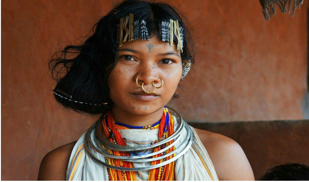
(Una mujer tribal de los bosques de Gondi en la India. El nombre del supercontinente Gondwana se deriva de estos bosques. Se cree que el supercontinente de Gondwana existió hace unos 140 millones de años, y se cree que el África terrestre y la India surgieron de él)

Cuando la India se separó de África hace milenios, llevó consigo los fragmentos de África tal como pudo haber existido entonces. Estos fragmentos de vida y tierra de África todavía existen en la India y uno puede notarlo de muchas maneras. El más importante de ellos es la "coexistencia pacífica entre diversos y muchos". La gente, tanto en África como en la India, está marcada por haber vivido con sus múltiples tradiciones y creencias desde hace siglos. Siempre pensamos en esta diversidad cultural y tradicional como una ventaja más que como una desventaja. Un buen número de estudios respaldan ahora que la resolución de conflictos entre comunidades es mejor cuando son intrínsecamente diversas. Estas sociedades se caracterizan por fuertes compromisos familiares y sociales y respeto por los mayores. La coexistencia eterna de varias comunidades ha sido posible en África e India debido al reconocimiento de esta sabiduría de percibir la unidad subyacente en la diversidad. En África, lo vemos en su filosofía nativa, Ubuntu, "Yo soy porque nosotros somos". Aboga por la dependencia de la vida individual sobre la vida colectiva. En India, lo filosofamos como "Vasudhaiva Kutumbakam", que significa "El mundo es una familia". Volvemos a ver el reflejo de esta filosofía de convivencia en el lema favorito de nuestro Primer Ministro, "Sabka Saath Sabka Vikas", que significa "Con esfuerzos colectivos, todos prosperan".